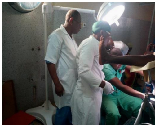
Examen pré opératoire des patientes