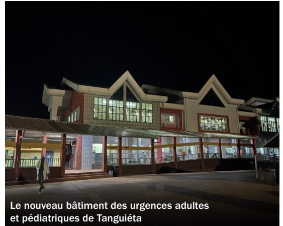
Le nouveau bâtiment des urgences adultes et pédiatriques de Tanguiéta

GFMER/ Fistula Group vont continuer de soutenir l'Hôpital de Tanguiéta, pour la prise en charge globale des patientes souffrant de fistules génito-urinaires ainsi que des cas d'urologie générale. Une mention spéciale concerne les prolapsus urogénitaux dont GFMER/ Fistulagroup financent un certain nombre d'opérations dans le pays. Ces femmes portent un lourd handicap au quotidien, avec l'utérus qui sort du vagin, et une opération leur rend confort et dignité. C'est depuis plusieurs années que nous intégrons la prise en charge des prolapsus à notre programme de fistules obstétricales.